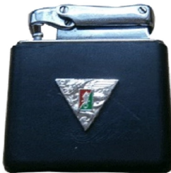
Période Algérie au 2ème R.E.P.