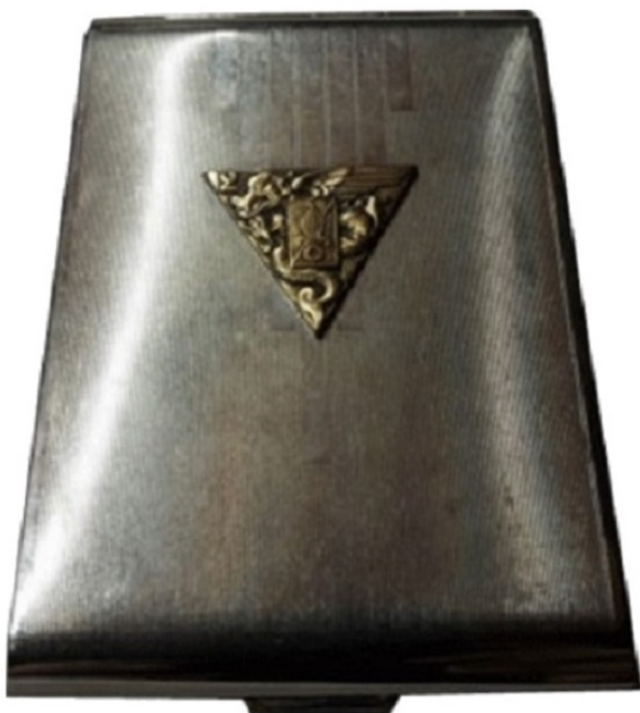
Période Indochine au 2ème B.E.P.

Les étuis à cigarettes. Vendus au foyer.