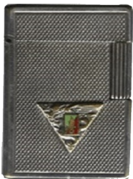
Période Indochine au 2ème B.E.P.