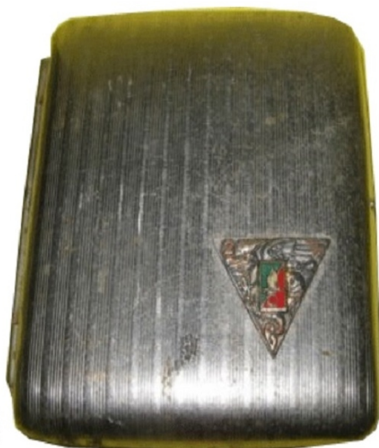
Période Algérie au 2ème R.E.P.